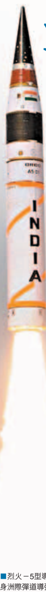
■烈火-5型導彈成功發射，令印度躋身洲際導彈俱樂部。

韓國國防部昨日在首爾宣布，部署韓軍自主開發、可摧毀朝鮮境內任何導彈和核設施的遠程導彈系統，能摧毀1,000多公里內的目標。