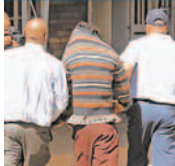
■輪姦少女的其中一名疑兇(中)。網上圖片

南非索韋托一名心智有缺陷的女孩4周前開始失蹤，她遭輪姦的片段本周二在當地以手機廣泛流傳，警方前日終捕8名疑犯，救出受害者。8名涉案者年齡由14至20歲不等，部分仍是學生，均被控綁架及強姦罪，檢察官表示，將尋求判處疑犯終身監禁。事件令外界再次關注南非非性罪行猖獗問題。