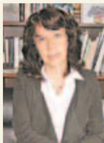
卡博接受本報專訪。

法國兩翼政黨抨擊中國以迎合民意，亦會通過對華施壓轉移內部矛盾。崔洪建指出，比起薩科齊，在野社會黨候選人奧朗德對華抨擊力度更大，反對中國援歐政策，又抨擊中國人權。但他認為奧朗德「激進一面」因選舉需要被放大，當選後或仍按正常程序行事。崔洪建又指，奧朗德自身協同能力更強，處理問題亦更依賴現有外交機制，他若當選，中法關係反而會更平穩。