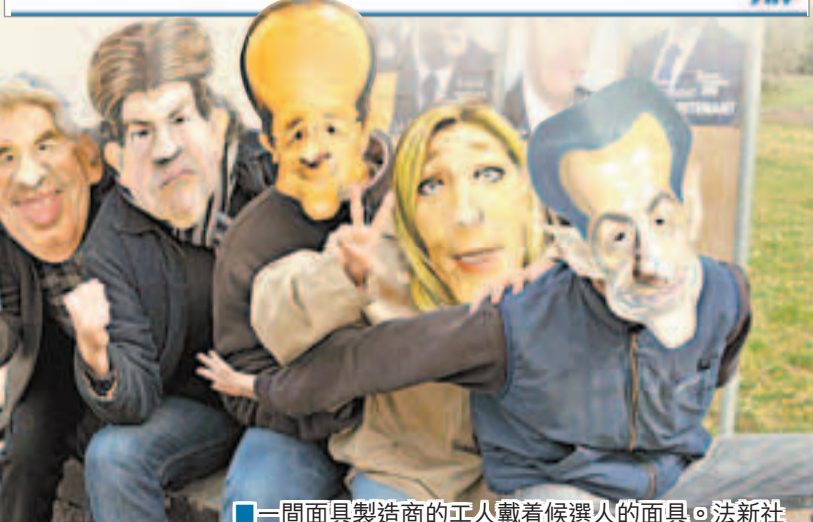
一間面具製造商的工人戴着候選人的面具。