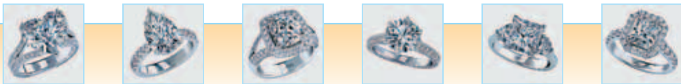
不同切割的卡裝主石配鑽石戒環，璀璨生輝。