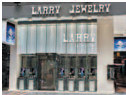
尖沙咀店舖位置優越，裝修清雅，為顧客提供舒適的購物環境。