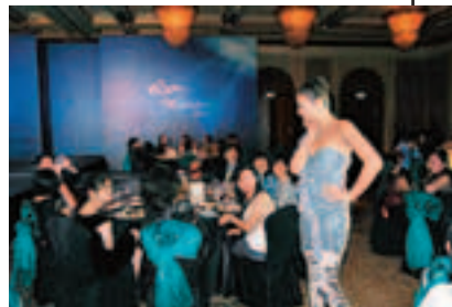
新加坡VIP貴賓晚會，衣香鬢影，是當地的城中盛事。

隨著互聯網科技發展，Larry Jewelry與時並進，建立Facebook及微博專頁，並不時舉辦粉絲活動，與顧客直接溝通交流。