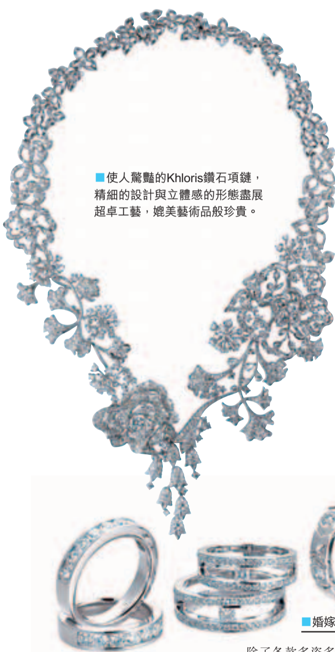
使人驚豔的Khloris鑽石項鍊，精細的設計與立體感展現超卓工藝，媲美藝術品般珍貴。

除項鍊之外，Khloris系列還包括不同形態的戒指、耳環及手鐲，其設計與手工絕不遜色於項鍊，每款首飾均只鑄造一件，保證獨一無二。Khloris系列不但見證了Larry Jewelry對頂級鑽飾的極致追求，同時體現了它在本港高級珠寶業的翹楚地位。細緻設計、經典格調加上卓越工藝，自然是鑽石愛好者和收藏家夢寐以求的永恆珍品，絕對值得永久珍藏。