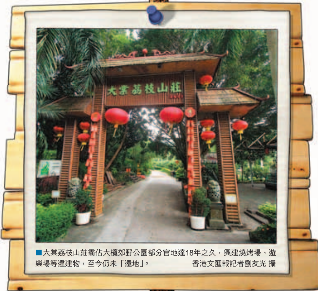
大棠荔枝山莊霸佔大欖郊野公園部分官地達18年之久，興建燒烤場、遊樂場等搭建物，至今仍未「還地」。

香港文匯報訊（記者 林裕華）香港非法佔用官地違例興建搭建物的問題過之不絕，審計署昨發表報告，指地政總署去年接獲的相關個案較2008年增加15%，但檢控個案卻減少82%，顯示地政總署未能有效偵察官地被霸佔。同時，該署檢控不力及緩慢，霸佔官地者能透過申請短期租約，或遇警告後便清拆小部分搭建物作「拖字訣」，以致有官地被長期非法佔用，其中元朗大棠荔枝山莊霸佔大欖郊野公園部分官地達18年之久，至今仍未「還地」；新民主黨副主席史泰祖於上水的居所僭建，則在被發現後近20年才清拆。（尚有相關新聞刊A20版）