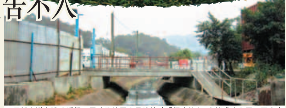
元朗水道有違建橋樑，因地政總署人員檢控時「擺烏龍」，未能成功入罪，至今未清拆。

審計署舉例指，元朗一條水道屬政府土地，2010年地政總署收到投訴，指有人在水道非法建造橋樑，遂派遣元朗地政處人員實地視察，發現違建屬實，當時有人向地政處人員表示會為違建橋樑負責。元朗地政處後來對該名負責人提出檢控，並錄取警誡供詞，但元朗地政處人員沒有要求該名人士在供詞上簽署，結果上庭時，被告抵賴，法庭最終裁定證據不足，被告罪名不成立，結果該違建橋樑至今仍未清拆。