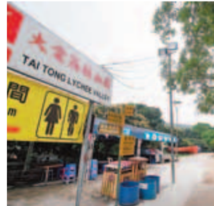
大棠荔枝山莊霸佔大欖郊野公園部分官地，僭建燒烤場、廁所等設施。