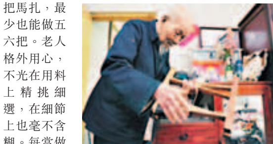
■老伯和他製作的板凳。網上圖片

把馬扎，最少也能做五六把。老人格外用心，不光在用料上精挑細選，在細節上也毫不含糊。每當做出一批成品，他都會到小區內轉悠，看到外面看棋或走路累了無處休息的老人們，他就會主動送上一把。由於老人的馬扎質量精良，他的名氣也越來越大，對登門索要馬扎的居民，他「來者不拒」。