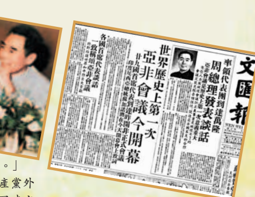
■《香港文匯報》1955年4月18日報道。(小圖)周恩來在萬隆會議上。

由於周恩來的努力，增進了各國對中國共產黨外交政策的了解，為後來一些亞非國家同中國建交創造了條件，為進一步發展中國同廣大亞非國家的友好關係打下了良好的基礎。