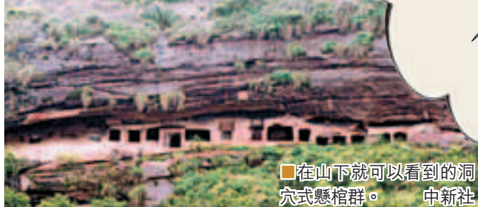
■在山下就可以看到的洞穴式懸棺群。