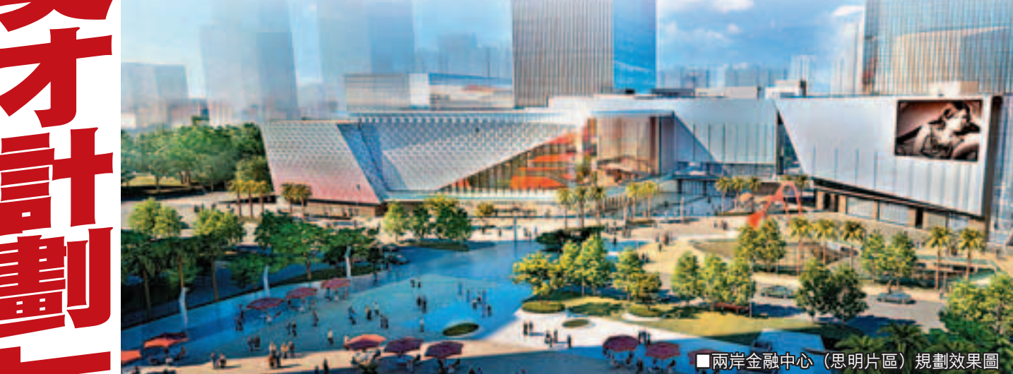
兩岸金融中心(思明片區)規劃效果圖