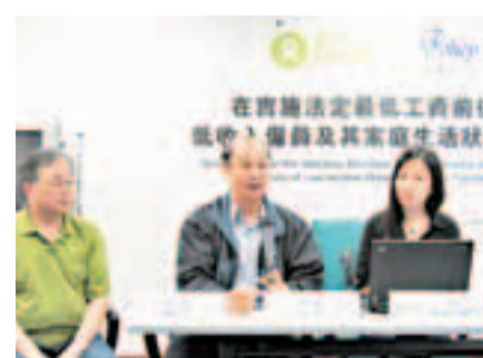
樂施會以追蹤調查方式比較最低工資實施前後對被訪者的影響。

以反映通脹及社會轉變，此外，並應確保獲最低工資僱員的其他福利不被剝奪。樂施會於去年3月至4月，及去年11月至本年1月進行了2次調查，以追蹤調查方式去比較最低工資實施前後對被訪者的影響，而2次訪問均有參加的共有520人。結果發現，有69.9%受訪者表示，住戶入息有所增加，由9,980元增至12,918元。有72.6%表示，其個人入息亦有增加，個人平均月薪由6,186元增至7,524元。