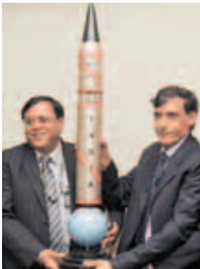
■印度「烈火」-5導彈模型。

據印度《昌迪加爾論壇報》前日報道，印度最精密、威力最大的彈道導彈「烈火」-5的首次試射已進入倒計時，如果一切順利，印度國防研究和發展組織(DRDO)今日將在