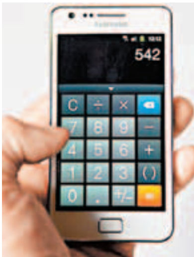
■據報三星Galaxy S3的屏幕會比S2(見圖)更大。

中文網站網易(NetEase)最近引述台灣傳媒報道指，蘋果公司可能於今年第3季度推出迷你版iPad，抗衡可能將面世、裝有Windows 8系統的平板電腦。而三星已開始邀請傳媒出席5月3日於英國倫敦的產品發布會，傳將展示新型號Galaxy S3。