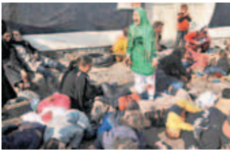
■侯賽因獲獎照片。

普立茲獎舉辦多年，管理人伊斯勒稱：「今屆得獎名單，反映新聞業界仍是有力的監察力量。」24歲的加寧任職地方小報《愛國者新聞》，憑揭露大學美式足球助性侵犯男童，奪「國內新聞獎」，成為今年最年輕得獎者。她稱，外界一直看輕地方報紙，這次能爭回一口氣。