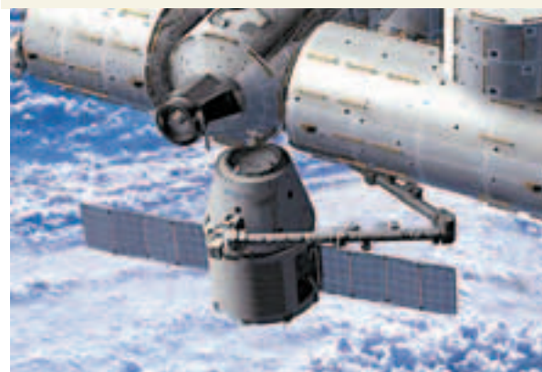
■「龍」發射至太空站模擬圖。網上圖片

美國太空總署(NASA)前日在休斯敦約翰遜航天中心宣布，美國太空探索技術公司(SpaceX)將於本月30日發射一艘名為「龍」的無人貨運太空船，標誌國際太空站將首次迎來私營企業建造的太空船，也是太空穿梭機退役