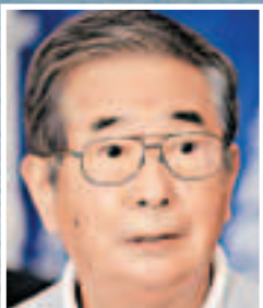
■東京都知事石原慎太郎。

香港文匯報訊（記者 葛沖 北京報道）日本東京都知事石原慎太郎16日在訪美期間發表演講稱，東京都政府將於今年內從私人手中「收購」釣魚島部分島嶼。石原相關言論曝光後，引發了中國民眾強烈不滿，中國民間保釣聯合會對石原的言論嗤之以鼻。中國外交部則重申，釣魚島及其附屬島嶼自古以來就是中國的固有領土，日方對釣魚島及其附屬島嶼採取任何單方面舉措，都是非法和無效的。