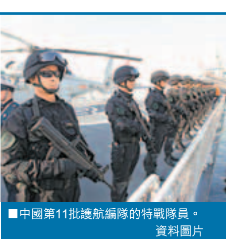
■中國第11批護航編隊的特戰隊員。

此外，人民網17日援引美國媒體報道，消息人士稱，在朝鮮發射衛星、伊朗核問題、敘利亞問題都需要中國幫助解決難題的時候，華盛頓斷不會為菲律賓得罪中國，華盛頓當局還是希望菲律賓在今後「好自為之」，而菲律賓對此應該心知肚明。