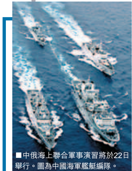
■中俄海上聯合軍事演習將於22日舉行。圖為中國海軍艦艇編隊。

中新社北京17日電 解放軍總參謀長陳炳德上將17日下午與俄羅斯聯邦武裝力量總參謀長馬卡羅夫大將進行了通話。通話中，陳炳德與馬卡羅夫共同批准了「海上聯合-2012」中俄海上聯合軍事演習方案，宣布演習將於2012年4月22日至27日在中國青島附近黃海海域舉行。