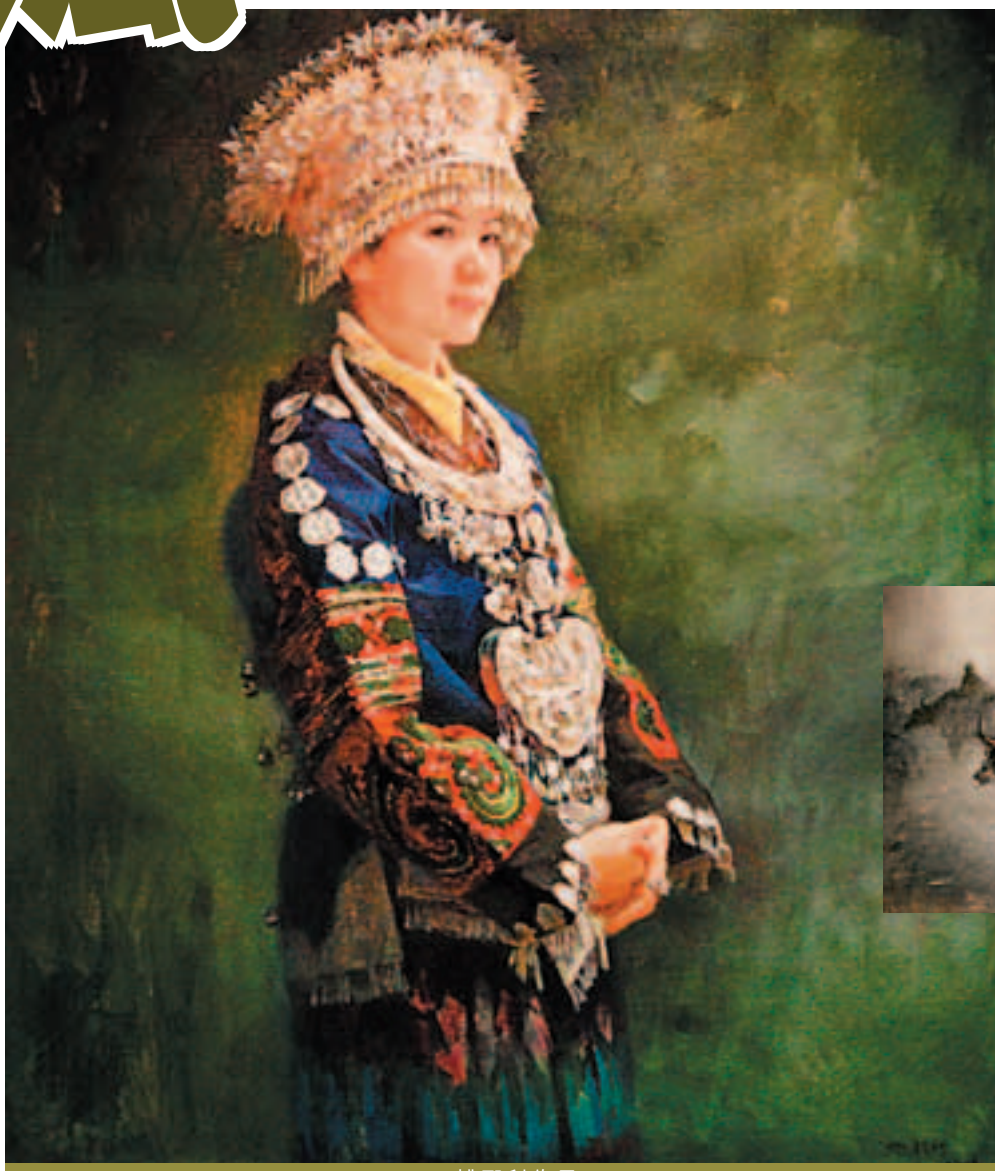
姚殿科作品《苗族女郎》

1959年，姚殿科入讀魯迅美術學院油畫系專修油畫，其後幾十年中，畫畫這個長項與習慣都沒斷過，此前在魯美教學期間，作畫要靠業餘時間，因而那時他主要多畫風光。「就在東北，圍繞着吉林，跑不遠，畫下東北的特點，畫滿山的紅葉。」後來去遠一些的地方寫生，譬如江西婺源，畫下那些古民居房子，再之後是去西藏。畫風景，可以豐富畫家的