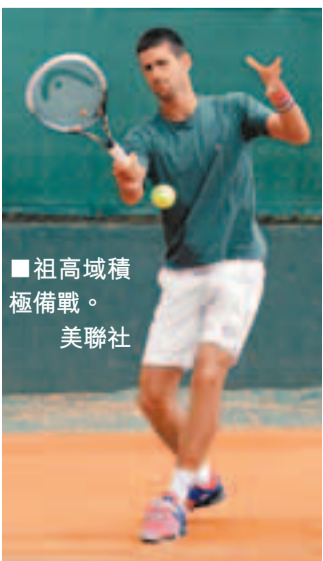
■祖高域積極備戰。