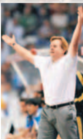
蘇斯達向拜仁致意。資料圖片