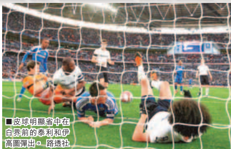
皮球明顯省中在白界前的泰利和伊高圖彈出。

英超球證艾堅遜於香港時間16日為車路士中場桑馬達的問題入球，向熱刺領隊哈列利納道歉。熱刺在溫布萊球場舉行的英足盃4強1:5不敵車路士，其中桑馬達攻入2:0的入波其實並未過白界，熱刺領隊哈列利納賽後說：「艾堅遜現在看得清楚了，他向我說他比我更難受，我說絲毫不覺得，但他堅稱自己很難過。他怎麼可能會覺得那是入波？那不是有人在門前倉促解圍，明明有人在白界上擋波，不可能入的！這些事情我們真的一點辦法也沒有，只能依靠科技協助判斷。」