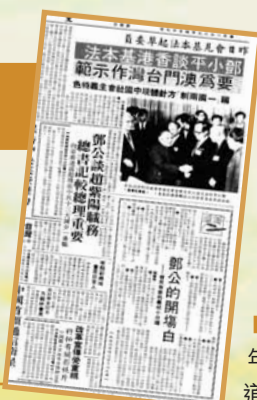
■本報1987年4月17日報道版面

祖國後它的現行制度50年不變,50年後更沒有變的必要。這個精神同時適用於澳門,也適用於將來按「一國兩制」方針解決統一問題的台灣。台灣按照「一國兩制」方針解決統一問題後50年也不變。