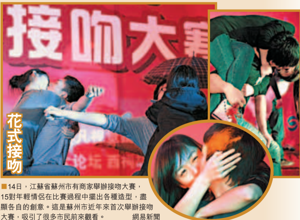
■14日,江蘇省蘇州市有商家舉辦接吻大賽,15對年輕情侶在比賽過程中擺出各種造型,盡顯各自的創意。這是蘇州市近年來首次舉辦接吻大賽,吸引了很多市民前來觀看。