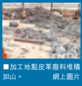
加工地點皮革廢料堆積如山。