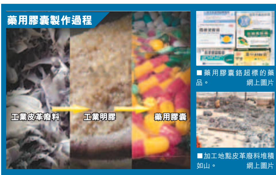
藥用膠囊製作過程

這些用皮革廢料當原料加工成的藥用膠囊不只是流入一些小型製藥廠，還居然流入內地知名的青海格丹丹東、吉林長春海外製藥等大型藥企，做成了各種膠囊藥品。根據調查中掌握的線索，央視記者分別在北京、江西、吉林、青海等地，對藥店銷售的一些製藥廠生產的膠囊藥品進行買樣送檢。經中國檢驗檢疫科學院綜合檢測中心反覆多次檢測確認，9家藥廠生產的13個批次的藥品，所用膠囊的重金屬鉻含量超過國家標準規定2mg/kg的限量值，其中超標最多的達90.05倍。