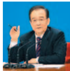
溫家寶總理撰文，強調要加強反貪力度。

香港文匯報訊 據新華網報道，16日出版的今年第8期《求是》雜誌，將發表國務院總理溫家寶題為《讓權力在陽光下運行》的文章，表明當局會堅持反腐倡廉。文章強調，雖然今年是本屆政府任期最後一年，但仍會要求各級、各地領導人，貫徹執行防止貪污工作，對查辦貪污案件不力的部門、官員，會嚴厲追究責任。 文章分三部分：一、政府改革建設和反腐倡廉工作取得新成效；二、2012年政府反腐倡廉建設的重點任務；三、把反腐倡廉部署落到實處。