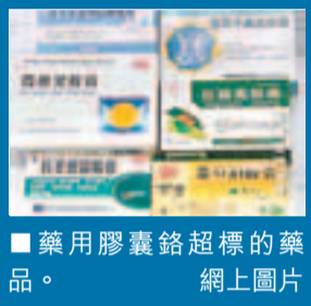
藥用膠囊鉻超標的藥品。