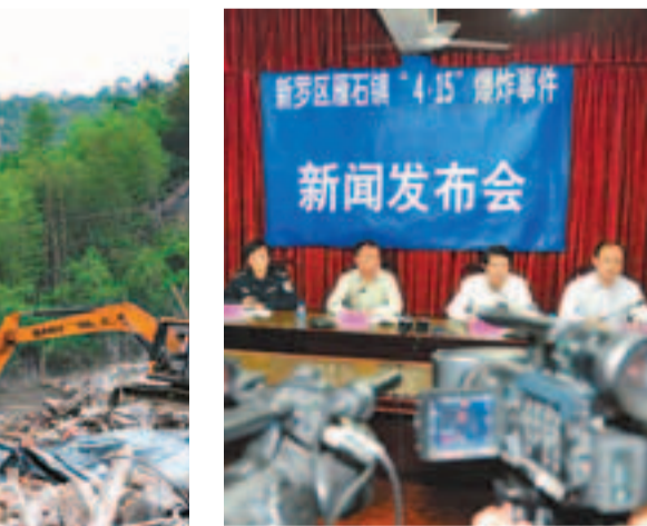
昨晚，福建龍岩市相關部門舉行新聞發布會。