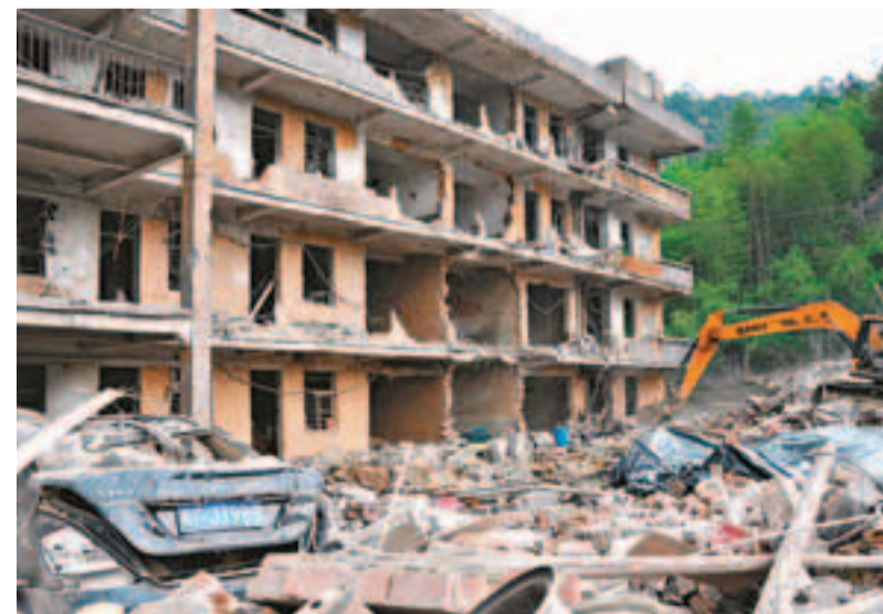
昨日，福建龍岩市新羅區雁石鎮蘇邦村一汽修廠發生意外爆炸事故，造成9死36傷。