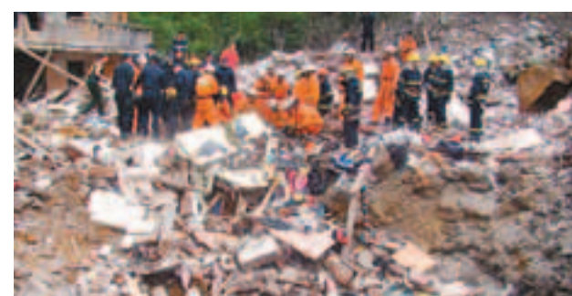
香港文匯報訊 (記者 盧麗寬 龍岩報道) 福建龍岩新羅區雁石鎮蘇邦村一汽車修理廠昨日上午發生爆炸，致使緊挨的一棟4層居民樓倒塌。