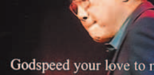
Godspeed your love to m