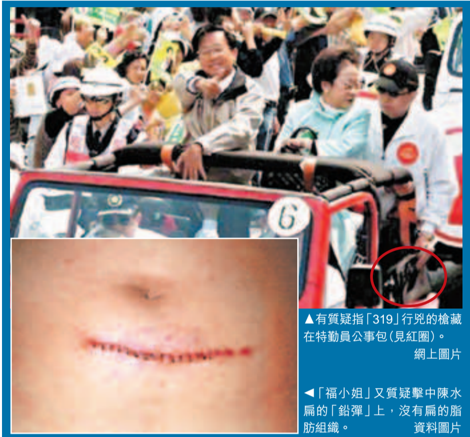
▲有質疑指「319」行兇的槍藏在特勤員公事包(見紅圈)。

呂秀蓮還質疑，發現彈殼的民眾中，包括一名槍擊熱區附近檳榔攤老闆的兒子。這個老闆2003年因持有改造貝瑞塔手槍被抓過，和319槍擊案的手槍是同型。