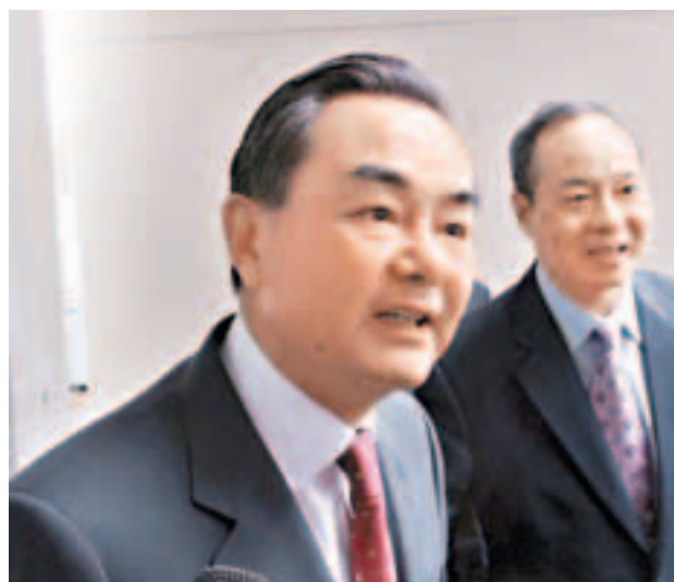
王毅在華府與美國國務院官員會談，會後接受媒體訪問。