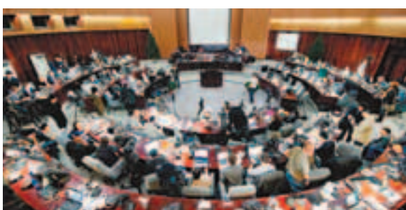
記者們在平壤的媒體中心等候消息。

朝鮮官方昨日上午11時後宣布「光明星3號」衛星發射失敗。據中國中央電視台報道，朝鮮政府原本安排媒體在飯店視觀看衛星發射，但在發射前夕取消連線，記者們對已發射衛星全不知情。