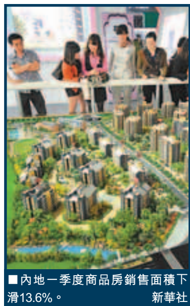
■內地一季商品房銷售面積下滑13.6%。

國家信息中心經濟預測部首席經濟師祝寶良認為，目前經濟放緩仍在政府預料之中，預計下半年經濟增長會有所好轉，政府尚不急於刺激經濟。不過，經濟學家普遍預測，考慮到目前企業信心不足，經濟整體活躍度偏低，宏觀政策尤其是貨幣政策的預調微調速度將加快步伐，二季應加快信貸投放步伐，並適當釋放流動性，近期下調存款準備金率的預期頗高，並有下調貸款利率的呼聲。