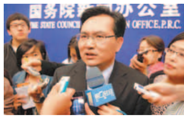
■國家統計局新聞發言人盛來運表示，首季GDP增幅仍處於高速合理區間。

香港文匯報訊 (記者 海巖 北京報導) 中國經濟減速跡象日益明顯，第一季度國內生產總值 (GDP) 同比增長8.1%，低於此前市場預測的8.4%，是連續第五個季度回落，也是2009年2季度以來最低增幅。但昨日召開的國務院常務會議表態，中國經濟增速處於合理區間，要及時預調微調，預留政策空間。經濟學家預計，下半年經濟增長將會好轉，貨幣政策微調速度將加快步伐，近期下調存款準備金率釋放流動性的預期頗高。