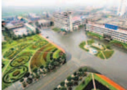
■兗礦集團骨幹煤礦東灘煤礦。