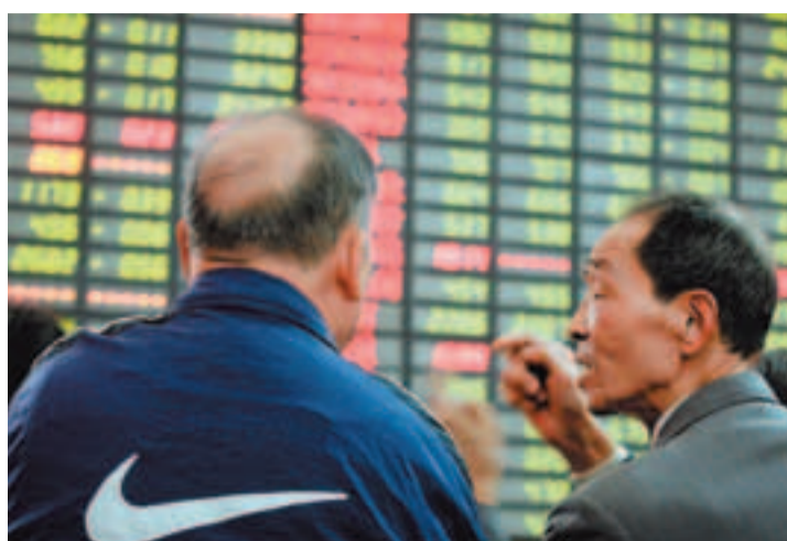
受金融創新消息的刺激,上證綜指創出兩個月最大單日漲幅。