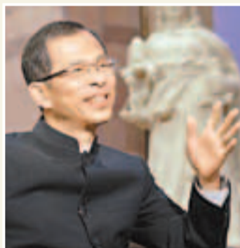
■曾鈺成昨日接受電台節目訪問。

建制派在競選期間造成的裂痕。立法會主席曾鈺成認為要促進團結和解，不是一頓飯可以做到，亦不應將缺席飯局的議員視為拒絕和解，實現大和解的關鍵是梁振英在組織管治團隊、落實各方面政策措施時要公道，不能夠親疏有別。