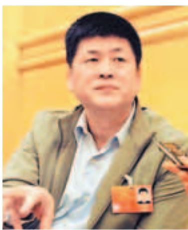
■益陽市委書記馬勇表示,圍繞環洞庭湖生態經濟圈,益陽將着力打造四個示範區。

鄉統籌工作起步早,效果好,而且下一步發展空間非常大。第二是打造生態建設示範區。自2008年起,益陽市委、市政府就提出了建設「綠色益陽」的目標,經過幾年的實踐,益陽不僅在經濟總量上有了快速提升,而且綠色生態、綠色生產、綠色消費、綠色文明等方面的工作都得到大幅度推進。