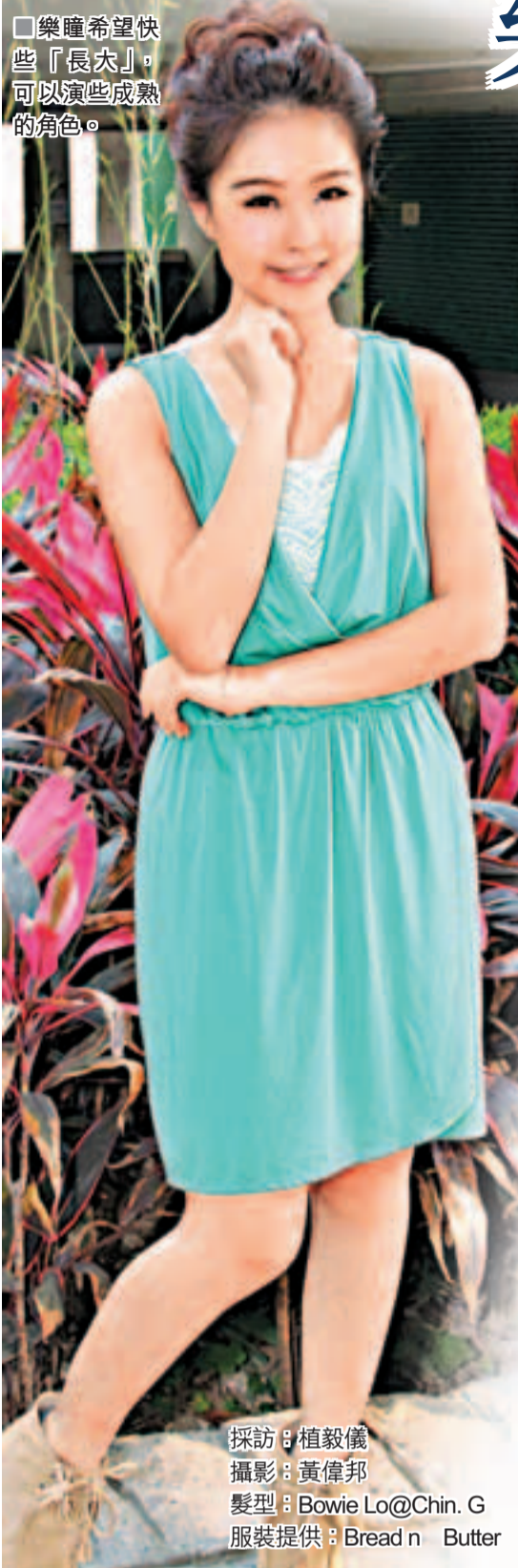
採訪：植毅儀 髮型：Bowie Lo@Chin. G 服裝提供：Bread n Butter

溫馨喜劇《當旺爸爸》本周進入結局篇，復活節假期平均收視31點，最高收視33點，打破了復活節低收視的宿命。劇中飾演三妹的樂瞳(Cilla)在劇中翻唱《凍咖啡》引起網民熱論，更有不少人問唱歌出身的樂瞳何時再出碟，令伊人喜上眉梢。歌手出身的她，更希望2年內有自己音樂會，回饋歌迷！