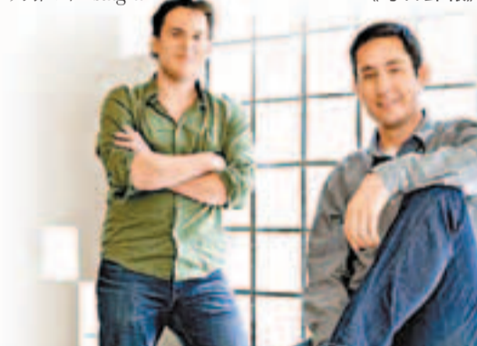
Instagram創辦人基斯羅姆(右)2004年拒絕fb創辦人朱克伯格邀請加入，這曾令他非常後悔。