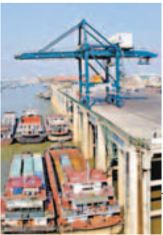
■西江黃金水道上的貴港碼頭。

廣西自治區政府副主委楊道喜表示，西江經濟帶對協調廣西發展格局乃至西南地區經濟社會發展都將產生巨大的影響。到2030年，最終形成與東盟、粵港澳、西南三大板塊分工合作、優勢互補的發展格局。