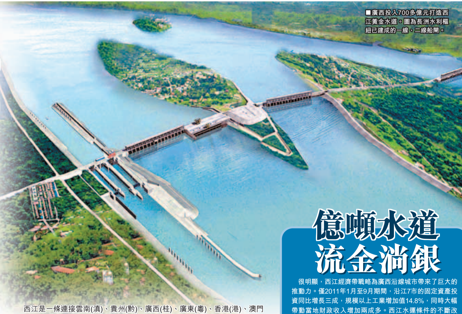
■廣西投入700多億元打造西江黃金水道。圖為長洲水利樞紐已建成的一線、三線船閘。