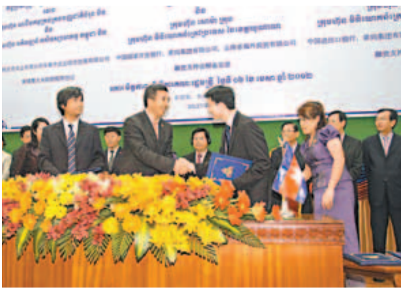
東中農業綜合發展有限公司(CCAD)揭牌成立後，與中儲糧廣州分公司、中國進出口銀行等簽署相關協議。

推介會上舉行雙邊合作項目簽約及項目推介活動，雙方共有3個項目現場簽約，金額9,900萬美元，在對口洽談會上，雙方達成7個項目的合作意向，意向性合作金額達到7.7億美元，涵蓋貿易、相互投資、文化產業、基礎設施建設等多個領域。