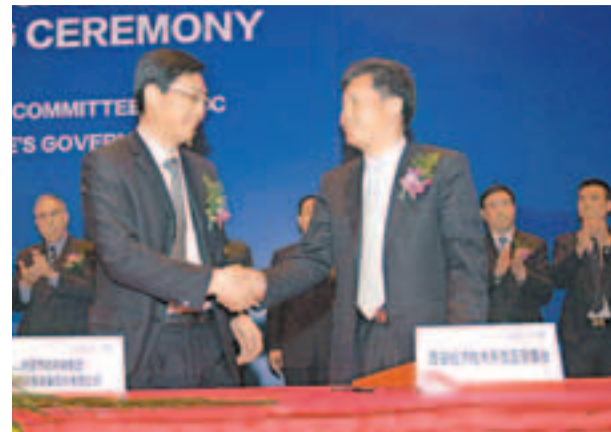
中國節能環保集團與西安經開區簽約建設放源高節能環保裝備項目。本報西安傳真

香港文匯報訊(記者 胡素玉 西安報導)第16屆西洽會西安市團集中簽約儀式日前在陝西省西安舉行，西安經濟技術開發區現場簽約中國節能、北車永濟、日本大河精工株式等5家知名企業，簽約金額達60億元(人民幣，下同)。據悉，該區所簽項目全部集中在節能環保、新能源、新材料、高端裝備製造等戰略性新興產業領域。