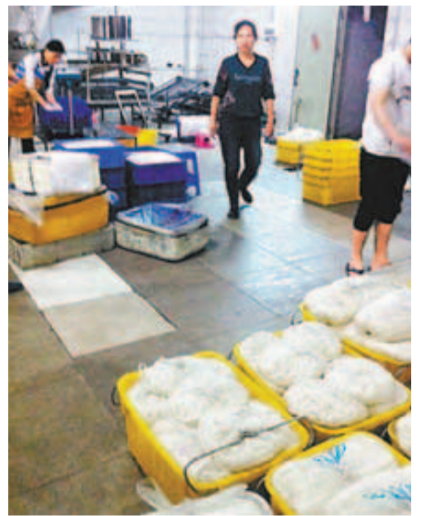
■加工河粉的作坊環境惡劣,氣味刺鼻。