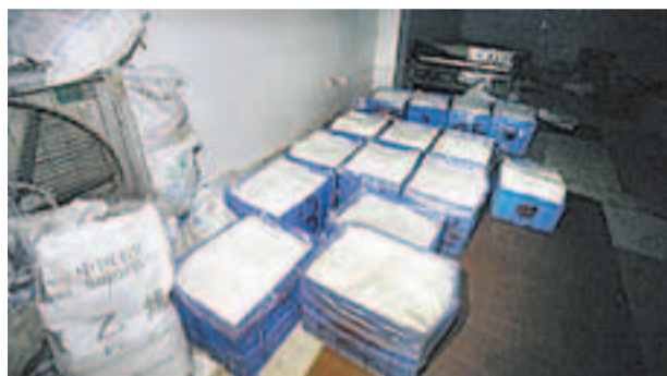
■剛做好的河粉被胡亂擺放在雜物旁邊。