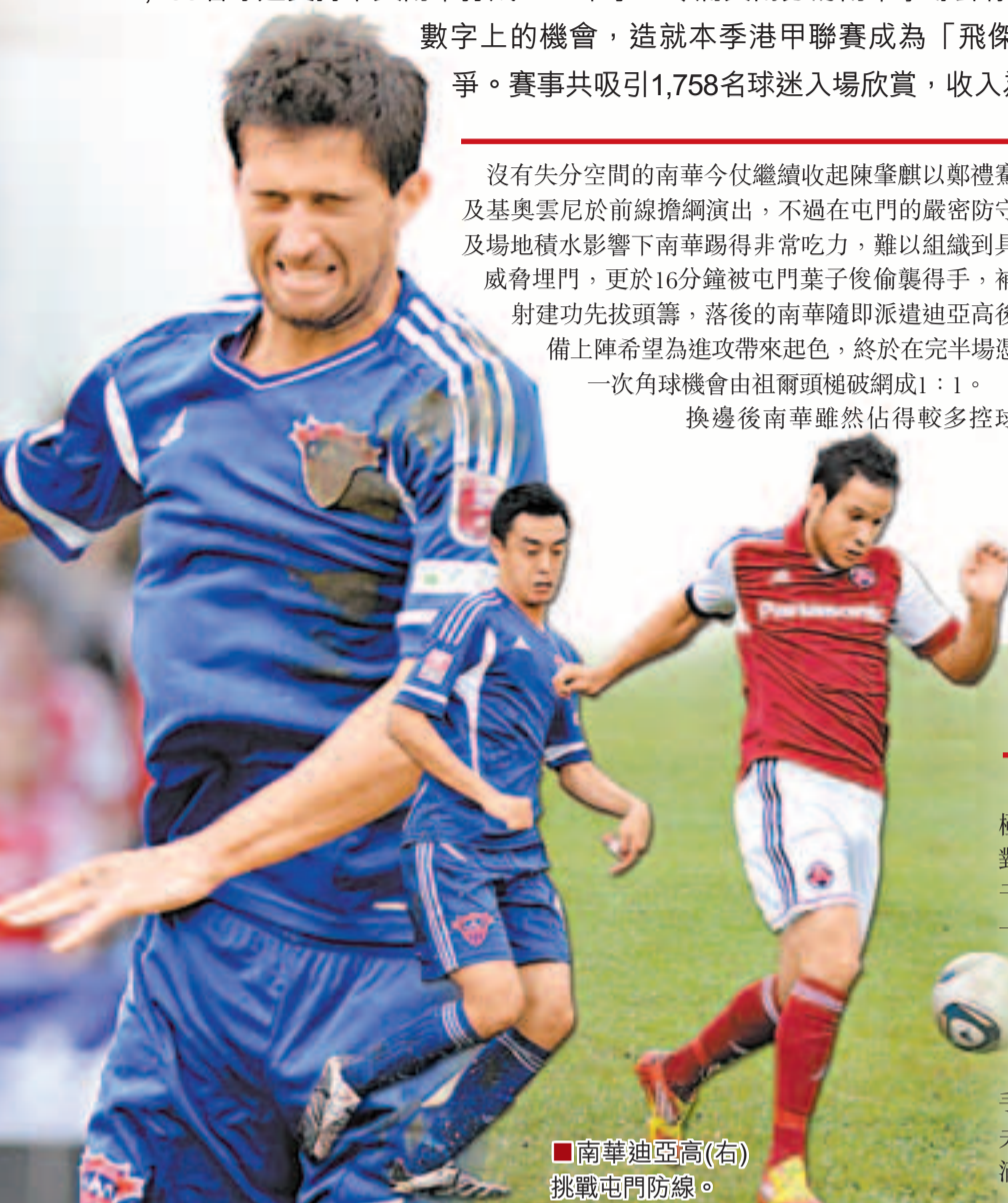
南華迪亞高(右)挑戰屯門防線。