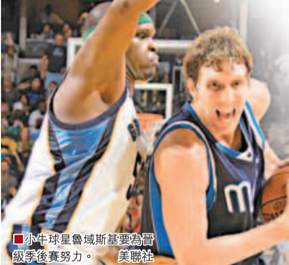
小牛球星魯域斯基要為晉級季後賽努力。