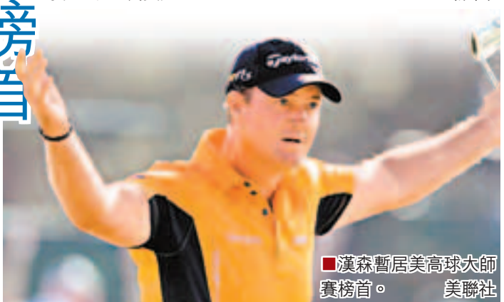
漢森暫居美高球大師賽榜首。 美聯社

始於1934年的美國大師賽從1949年起,凡獲冠軍的選手都會穿上比賽球場奧古斯塔俱樂部綠色西裝上衣。今年比賽總獎金為800萬美元。 新華社