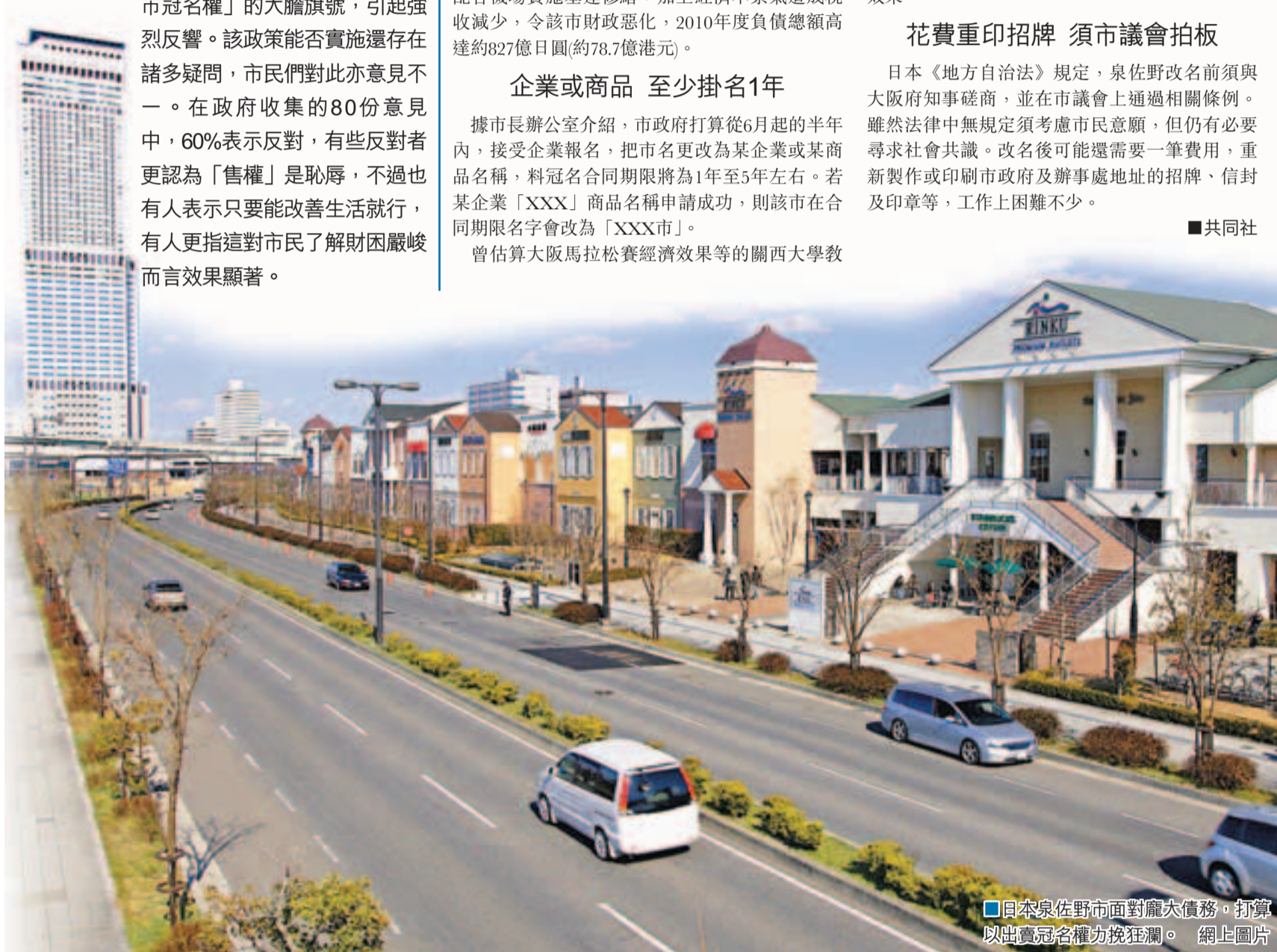
日本泉佐野市面對龐大債務，打算出售冠名權力挽狂瀾。網上圖片

歐元國債息率不斷上升，截至3月底，西國債息由5.332厘攀升至5.735厘，意大利與德國國債息差也擴大至3.67厘。 ■法新社