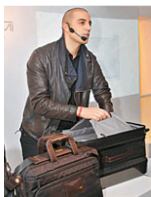
■ Dror示範利用活鉸將行李箱擴充空間，可作不同尺寸靈活變化。