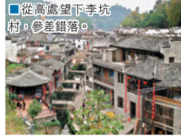
從高處望下李坑村，參差錯落。

李坑，是一個以李姓聚居為主的古村落，在秋口鎮，北宋大中祥符三年（1010年）李洞建村，距婺源縣城12公里。李坑自古文風鼎盛，人才輩出，有文昌閣、大夫第、通濟橋、日月池等景點。村落群山環抱，山清水秀，風光旖旎。村內遍佈明清古建築，民居宅院沿溪澗依山而立，粉牆黛瓦，參差錯落。一條小溪穿村而過，小溪上不時有形態各異的小橋與溪埠相鑲嵌。進入李坑村，彷彿走過「小橋流水人家」的畫卷裡。