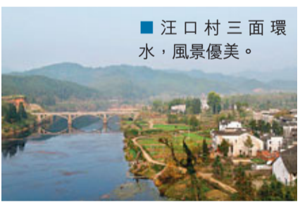
汪口村三面環水，風景優美。

汪口，古稱永川，建村於北宋大觀三年（1110年），有18條從村後直通河邊的主巷道，每個臨河巷道口都建有一個溪埠，因居江灣與段莘河流的匯合處，村子三面環水，故名「汪口」。汪口官路正街的店舖頗具地方特色，一般為前店面、中起居、後伙房、樓倉庫的布局形式，其古建築俞氏宗祠氣勢宏偉，布局嚴謹，工藝精妙，是名副其實的「江南第一祠」。