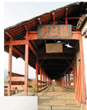
歷史悠久的彩虹橋。

彩虹橋，歷史悠久，建於南宋，距今已有八百多年，是古徽州最古老、最長的廊橋，橋全長140米，橋面寬3.1米，橋四墩五洞，整個橋面由十一座廊亭組成，被譽為「中國最美的廊橋」之一。彩虹橋設計精妙，遠望各廊亭緊接連為一體，近看則互不銜接，一來使得廊亭高矮不齊，錯落有致，更顯古樸壯觀。如乘竹筏於橋下的小西湖，村落、木板橋、鴛鴦樹、水車……構成了如詩如畫的山裡水鄉。