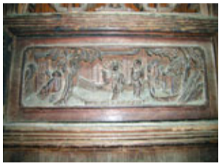
你看！這木雕多精緻。