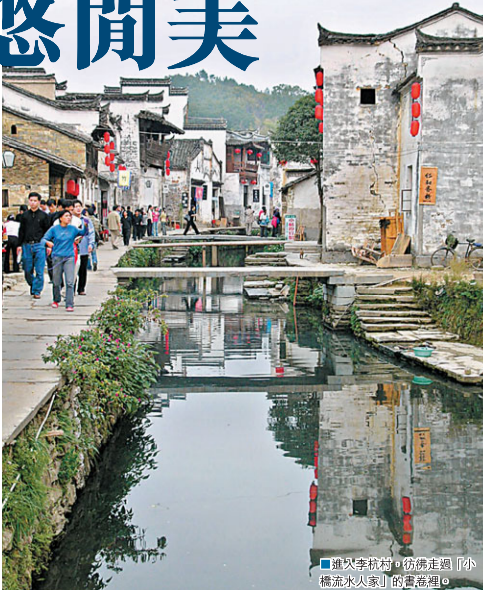
進入李坑村，彷彿走過「小橋流水人家」的畫卷裡。