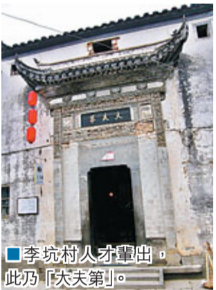
李坑村人才輩出，此乃「大夫第」。