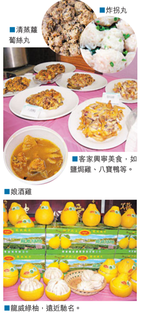
炸拐丸、清蒸蘿蔔絲丸

婺源的民俗文化歷史悠久，豐富多彩，主要有傩舞、茶道、燈彩串堂班、地戲、抬閣、板龍燈、婚慶等。