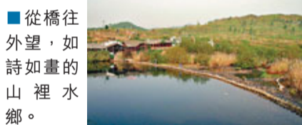
從橋往外望，如詩如畫的山裡水鄉。