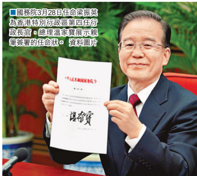
國務院3月28日任命梁振英為香港特別行政區第四任行政長官。總理溫家寶展示親筆簽署的任命狀。資料圖片

香港文匯報訊（記者 鄭治祖）香港特區候任行政長官梁振英明日正式啟程前往北京接受中央政府任命。據悉，國家主席胡錦濤、國務院總理溫家寶、國家副主席習近平等中央領導人將會見梁振英。梁振英表示，此行會盡量向中央全面反映香港各界的意見，包括工商、金融及專業界有關國家「十二五」規劃及CEPA的意見，有機會亦會提出諸如內地「雙非」孕婦湧港產子等港人普遍關心的問題；他並會邀約與在北京生活及工作的香港人會面。