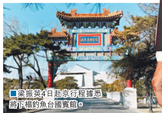
梁振英4日赴京行程據悉，將下榻釣魚台國賓館。

溫家寶是在是次會上說，香港特別行政區第四任行政長官選舉是依法進行的，符合香港特別行政區基本法和有關法律的規定。梁振英的當選，反映了香港社會對他的認同、信任和期望，並相信梁振英就任行政長官後，一定會帶領香港特區政府，緊密團結香港各界人士，繼往開來，齊心協力，努力發展經濟，改善民生，推進民主，保持社會和諧，把香港建設得更加美好。