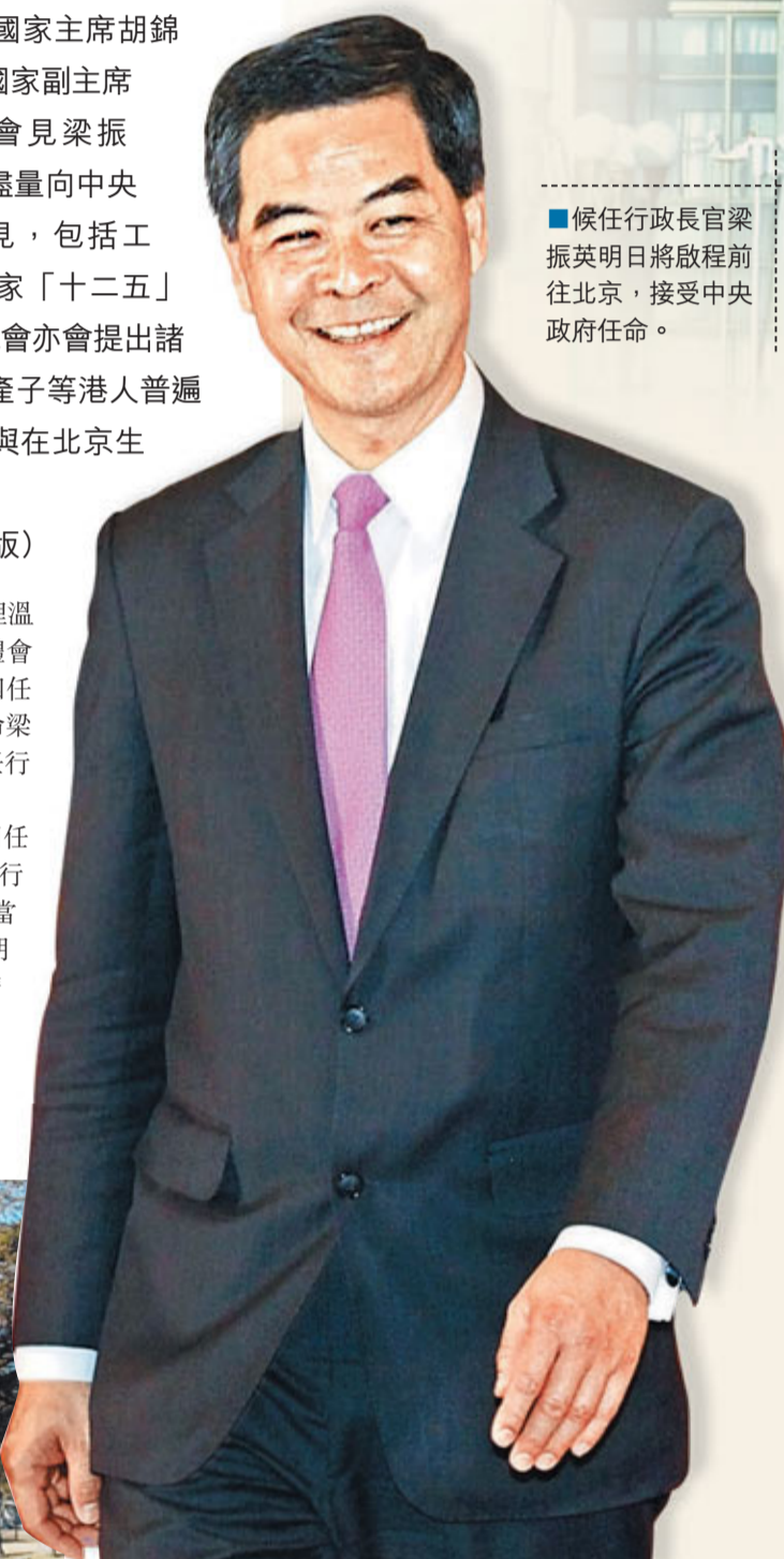
候任行政長官梁振英明日將啟程前往北京，接受中央政府任命。