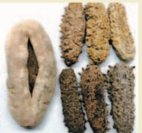
■左澳洲白石參，上為中東刺參，下為南美刺參。