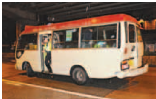
公共小巴在加士居道被貨車撞毀車尾。

香港文匯報訊(記者 杜法祖)油麻地加士居道昨凌晨發生交通意外。一輛密斗貨車沿加士居道駛至志和街交界交通燈位前,懷疑未能及時煞停,撞向前面一輛公共小巴車尾。由於撞擊力猛烈,小巴被撞至衝前約10米始停下,車上一名乘客受傷。警方正調查肇事原因。