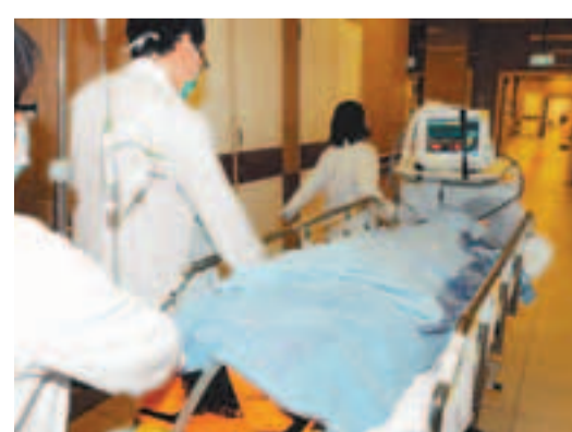
聯合道車禍被捲入巴士車底重創婦人送院。

前晚11時42分,一輛行走大埔富善邨至九龍城碼頭75X路線雙層巴士,沿九龍城聯合道北行。該巴士途至衙前圍道附近,突有一名婦人推一部手推車,從路旁走出橫過馬路。雙層巴士