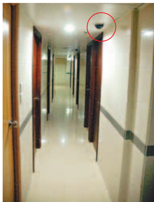
割房樓層天花頂裝有閉路電視鏡頭(紅圈)。

兒子志願是回澳門當警察,但中五畢業後投考警察時,驗身發現遺傳母親的糖尿病未獲錄,自此意志消沉。後來他誤交損友,曾販賣盜版光碟,亦曾任職食肆及售貨員。一次到娛樂場所消遣,他與Coco認識,繼而發生此事。莫父稱雖然不清楚事件真相,但覺得兒子一走了之不是辦法,希望兒子現身面對事件。