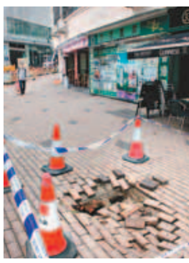
跑馬地黃泥涌道行人路路陷。

另昨晨9時許,跑馬地黃泥涌道31號對開行人路,一幅面積約1.5x1.5米地磚突然下陷。警員接報到