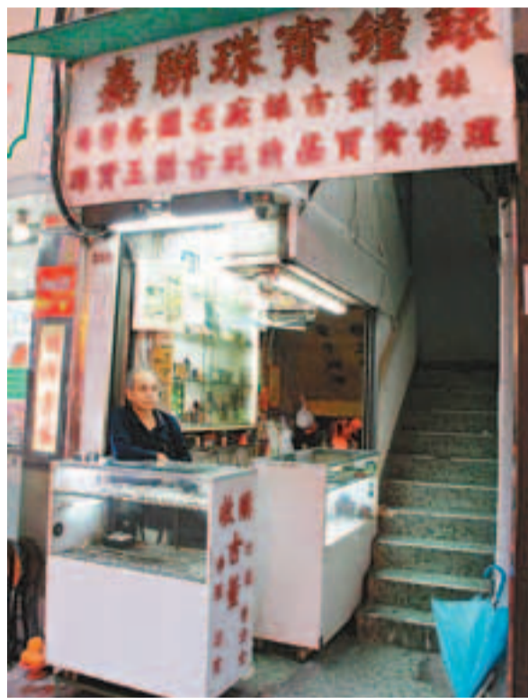
油麻地廟街遭夜盜爆竊的梯口珠寶鐘錶店。

據悉勞力士皇牌古董錶「棺材仔」,於1930年間推出市場銷售,並於1950年代後期停產。因為錶背圓拱,英文叫「Bubbleback」,直譯是「泡泡背」。另因「棺材仔」錶殼中間隆起,向上下延伸伸到錶帶,從側面看去,活像一副中式棺材,所以港人稱為「棺材仔」。