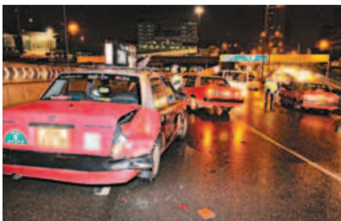
3輛的士在康莊道連環相撞,其中一輛車尾撞毀。

香港文匯報訊(記者 杜法祖)紅磡康莊道昨凌晨發生3輛的士連環相撞意外。一輛的士懷疑因天雨路滑突然失控,在路面連打數個「白鶴轉」後停下。尾隨另2輛的士收掣不及,撞向失控的士。3車均告損毀,意外中無人受傷。