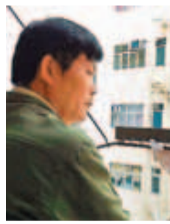
莫先生希望兒子現身面對事件。

Coco任職的夜總會,自命案揭發後仍如常營業,場內人士均議論紛紛。大批記者昨日欲向職員查探消息,有女職員叫記者勿逗留妨礙營業。她稱負責人不在,自己首天上班,對於Coco資料甚麼都不知道。