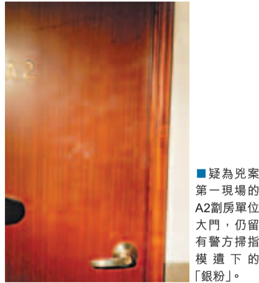
疑為兇案第一現場的A2割房單位大門,仍留有警方掃指模遺下的「銀粉」。