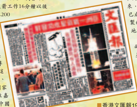
■香港文匯報1990年4月8日頭版報道亞洲一號衛星成功發射。

「亞洲一號」衛星的製造廠商美國休斯公司和亞洲衛星公司的專家，與中國航天專家一道進行了這次發射合作。成千上萬的漢、彝、藏等各族人民，以及來自17個國家和香港、台灣地區的200多位嘉賓，聚集在發射現場，目睹中國