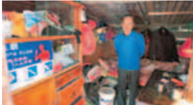
■房車雖小，五臟俱全。圖為睡房。