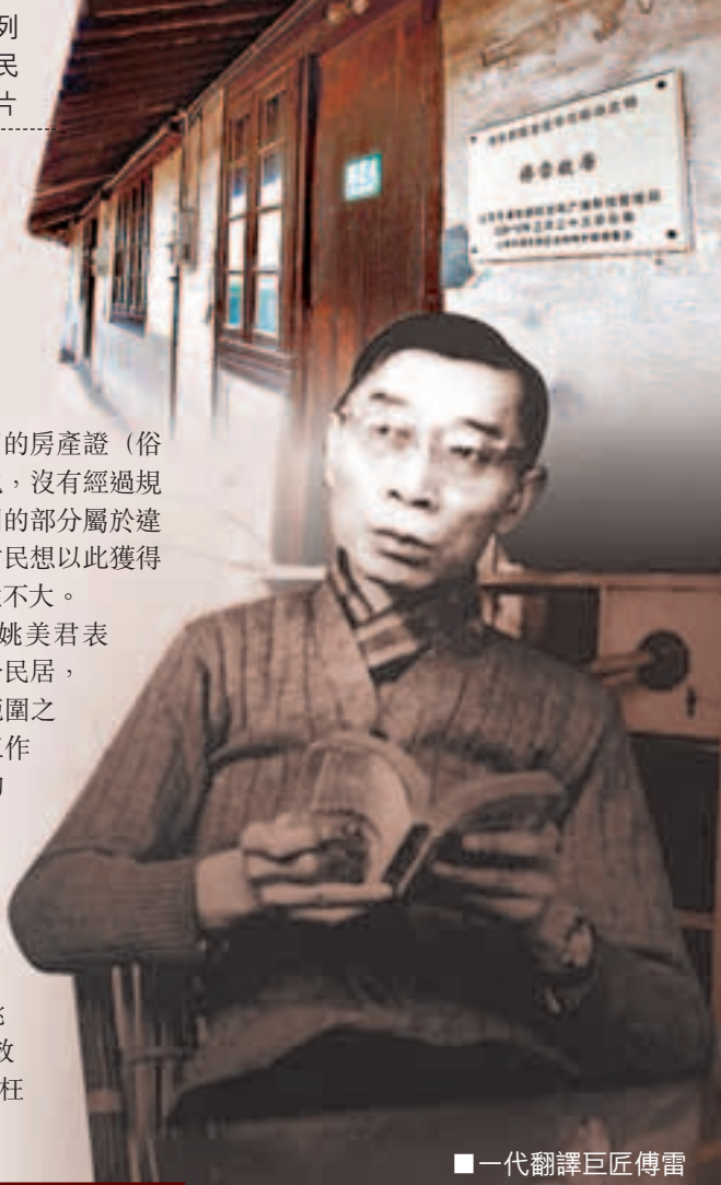
■一代翻譯巨匠傅雷