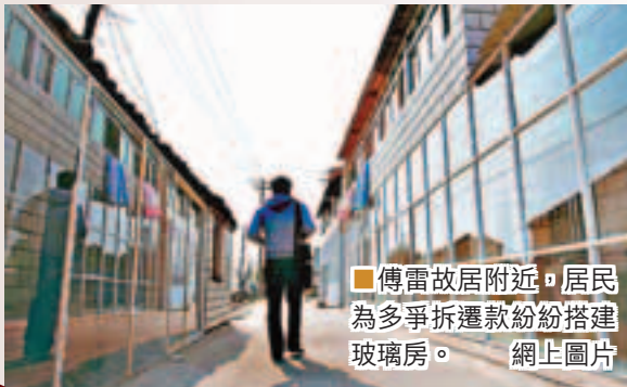
■傅雷故居附近，居民為多爭拆遷款紛紛搭建玻璃房。

傅雷1908年在上海南匯下沙傅家宅出生，也就是現在的航頭鎮王樓村五組。今年2月，浦東新區有關部門發佈消息，傅雷故居的修繕已被列入今年浦東新區航頭鎮的民生實事工程，進入前期規劃設計階段，計劃用3至4年時間完成修繕。