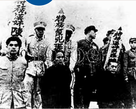
■建國初期，潛伏在中共的國民黨特務多不勝數。圖為處決反革命分子。