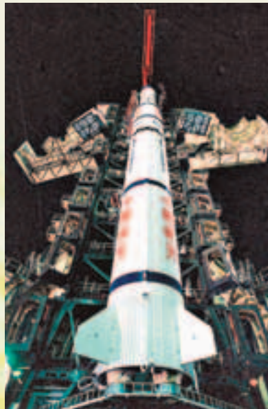
■吊裝完畢的亞洲一號衛星。

由中國長城工業公司承攬的這次發射亞星服務的合同，是1989年1月23日在北京簽訂的。從簽訂合同到發射前後僅14個月。