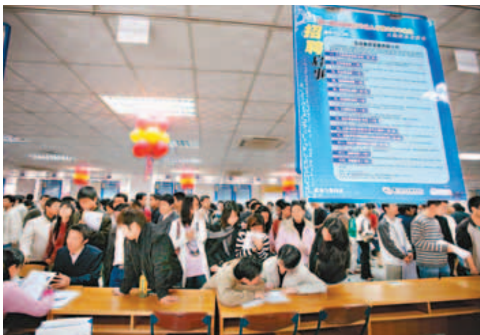
島內薪金水平低下，不少人才紛紛轉投海外發展。圖為台灣生在大陸招聘會上找機會。

尚達曼的話引起了「行政院長」陳冲的警惕。6日他說：「我們也注意到了，所以『行政院』有一連串育才、留才、育才措