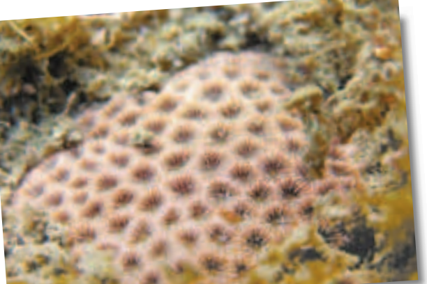
偽絲珊瑚群。

「柴山多杯孔珊瑚」也相當珍貴，是全世界多杯孔珊瑚中，目前已知生活在最淺水域的物種，全世界只有高雄柴山才有牠的蹤跡。有環保團體憂心，這兩種珊瑚分佈的地點都因為海岸開發而面臨生存威脅，希望當局能及時提供保護措施。團體指出，當地有着工程開發，工程動工將廢棄土方棄置海邊任雨水沖刷，如此粗暴的方式嚴重影響珊瑚生態生存。