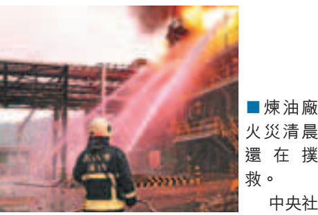
煉油廠火災清晨還在撲救。

傳出火災後，高雄市長陳菊前往了解情形，被民眾包圍表達對中油的不滿，批評災禍連連，讓居民驚心膽跳，要求市府一定要督促早日遷廠。她要求環保局開出最重的罰單，並促該廠依時程2015年遷廠。