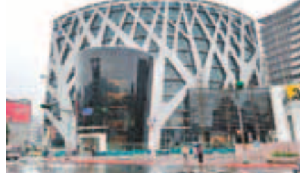
海基會新大樓外形似天燈，意在為兩岸和平祈禱。

商；他又若有所指表示，如果能在新穎、現代化場地(海基會新大樓)舉行，他認為相當適合。