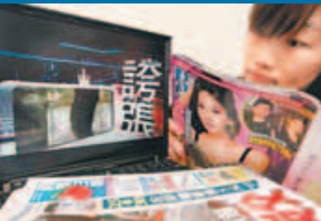
台灣壹傳媒坐擁不同媒體業務。

據了解，黎智英2001年以鉅資大舉進軍台灣媒體，發行《壹周刊》，將「狗仔文化」引進台灣，一度引起台灣媒體界震盪。隔年《壹周刊》轉虧為盈，《蘋果日報》便於2003年在台發行。2010年起，台當局陸續核發壹傳媒電視執照，黎智英的媒體事業正式從平面推展到電視，卻尚未取得傳統有線電