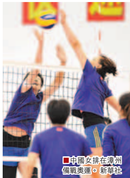
中國女排在漳州備戰奧運。

香港文匯報訊(記者 陳曉莉) 國家女排於3月22日進行了今年集訓的第一次素質教育講座，其目的是提升運動員的綜合素質，在國際賽場上表現出中國運動員的精神面貌和良好的公共形象。