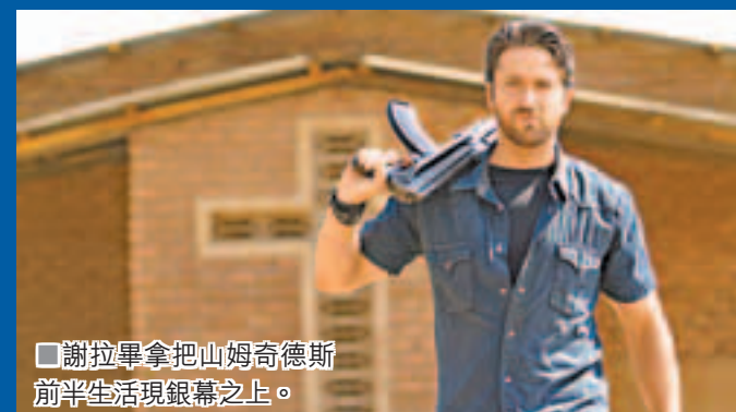
謝拉畢拿把山姆奇德斯前半生活現銀幕之上。