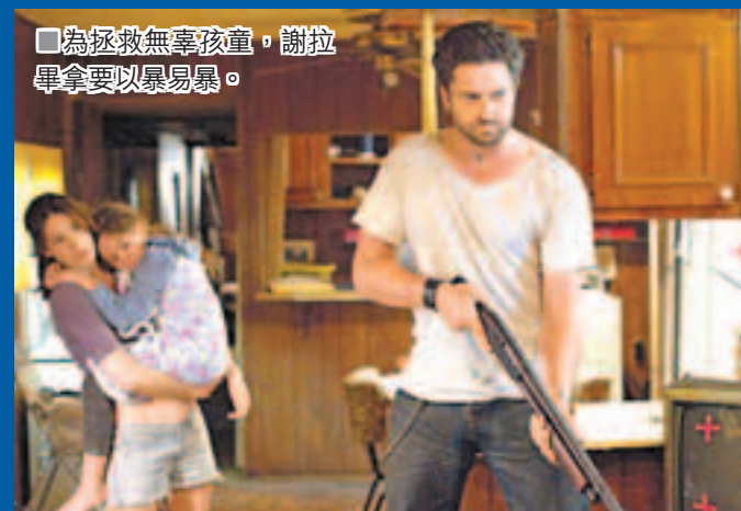
為拯救無辜孩童，謝拉畢拿要以暴易暴。