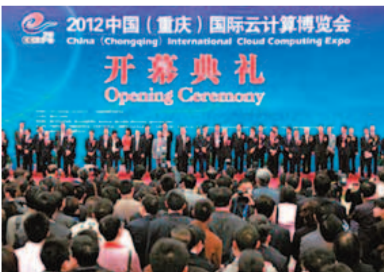
2012中國(重慶)國際雲計算博覽會開幕式現場。