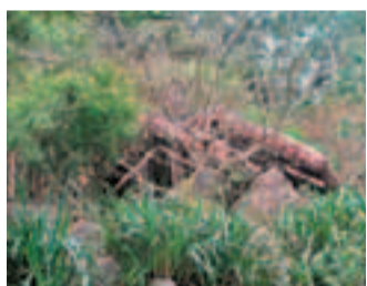
隱藏在園中的茅草小屋。

《南鄉子》的後半闕是：「世事莫論量，古今都輸夢一場，笑煞利名途上客，乾忙，千丈紅塵兩鬢霜。」