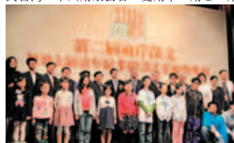
第二屆兩岸微文暨第七屆童年紀事繪畫比賽頒獎典禮。

台灣媒體人着力推動文藝活動，讓台灣看到大陸，也讓大陸看到台灣，不只看眼去看，更用筆、用心、用思考記載下人們在這個時代中不可多得的個人感受。大陸遊客以及每個愛台灣的人，都能從那些感受中看到自己眼中的寶島，並再度體味台灣人包容、耐心、理性的待客之道。