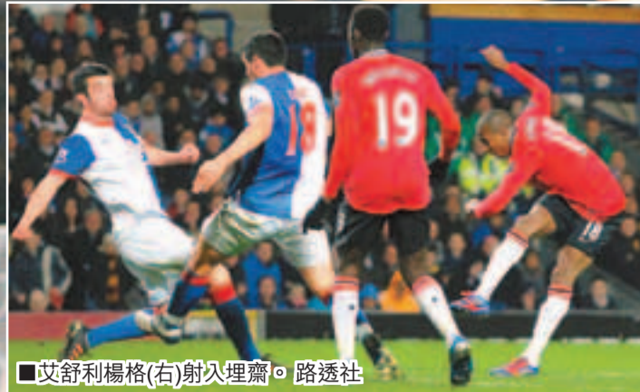
艾舒利楊格(右)射入埋齋。