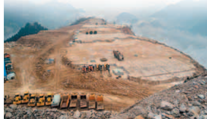
●張家壩礦山為中國按大理石儲量計最大的米黃大理石礦山

中國金石在發展下游業務方面踏出了重要的一步，透過收購廣東東莞開拓該地區的高端石材裝飾市場外，另外，亦與中國內蒙兩家大型房地產發展商簽訂供貨合同，銷售外購石材。