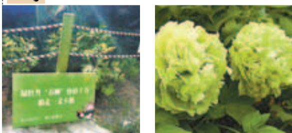
園方在修邊偷摘的牡丹 綠牡丹稀少，每株價值前警署示牌。網上圖片 10萬元。網上圖片

湖北武漢東湖牡丹節上展出的名貴綠牡丹在開園後沒多久竟遭遊客「辣手摧花」，在剛剛開放的15朵綠牡丹中，有4朵被遊客偷偷摘走，只剩下光禿禿的花莖，據悉，這種牡丹天生綠色，非常名貴，一株價值十萬。