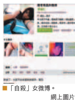
「自殺」女微博。網上圖片