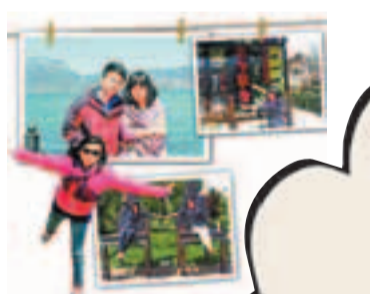
孫雲清的旅行照片。