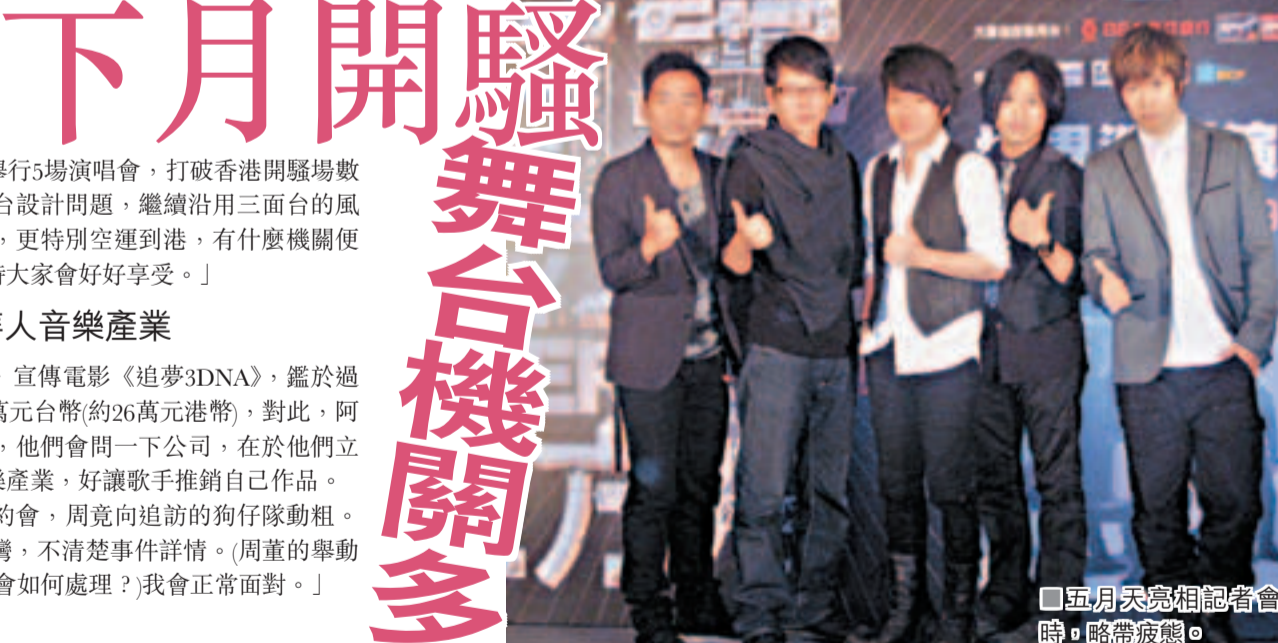
五月天亮相記者會時，略帶疲態。

五月天將於5月9、10及12至14日假紅館舉行5場演唱會，打破香港開騷場數紀錄，雖然他們說過要開四面台，現因舞台設計問題，繼續沿用三面台的風格，團長怪傑表示：「今次舞台機關較多，更特別空運到港，有什麼機關便先賣個關子，總之在紅館會很壯觀，望屆時大家會好好享受。」