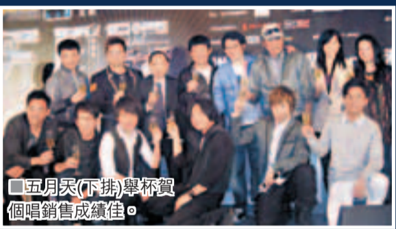
五月天(下排)舉杯賀個唱銷售成績佳。