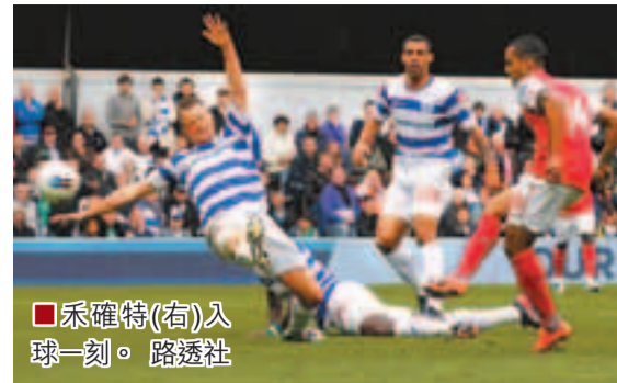
■禾確特(右)入球一刻。