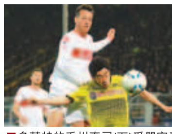
■多蒙特的香川真司(下)受嚴密看管。