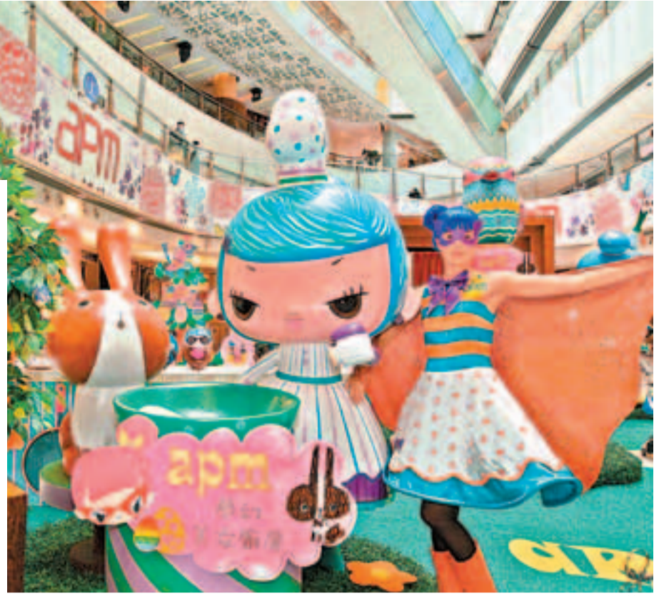
■ apm x 蘇飛夢幻復活之旅