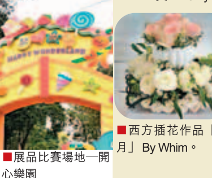
■ 東方插花作品「春光明媚」By Whim。 ■ 西方插花作品「蜜月」By Whim。 ■ 展品比賽場地一開心樂園