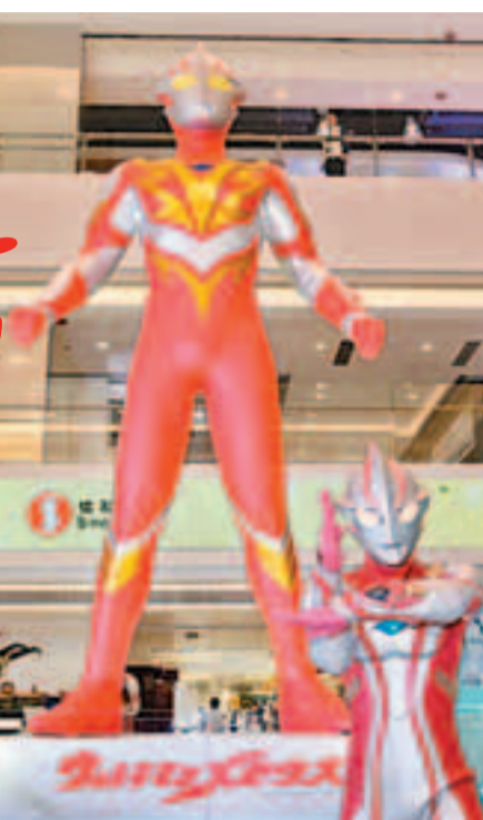
■ 屯門市廣場展示鹹蛋超人珍品。