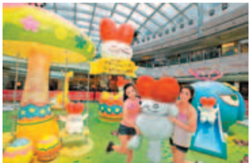
■ 新都城中心「bitbit兔遊樂園」

在復活節期間，不少商場設置了復活之旅，令大家可玩樂一番。例如，apm與本地潮流插畫師林皮攜手合作，舉辦「apm x 蘇飛夢幻復活之旅」，大堂化身成逾3000平方呎的「apm x 蘇飛夢幻復活樂園」，由有港版奈良美智之稱的蘇飛以多款時尚kawaii造型帶領大家走進奇幻有趣的復活世界。走入10呎巨型薰香復活彩蛋畫室，即場為蘇飛設計復活蛋，探索蘇飛的夢想成真星座館及夢幻美女廚房，又可安坐於8呎高的蘇飛甜咖啡座，讓大家與蘇飛一起遊走夢幻樂園，度過一個與別不同的歡樂復活節。