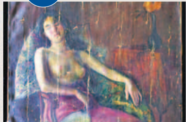
在中央美術學院美術館館藏室亮相的《半裸女像》。