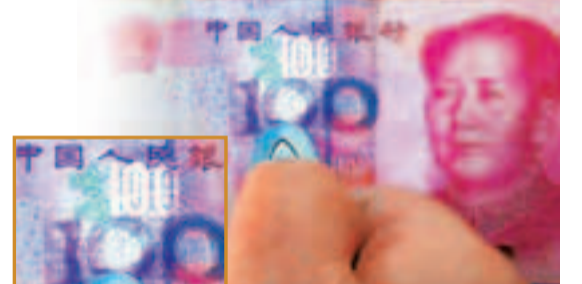
「100」的字樣旁神奇地出現了螢光暗記「哈哈」(小圖)二字。

內地媒體跟著做了「實驗」，在文具店花了15元，買到了一支傳說中的隱形螢光筆。這種隱形螢光筆外觀和普通中性筆並無多大差別，筆芯粗細和圓珠筆芯一樣，只是顏色為螢光色。隨後在一張百元鈔票上面寫上「呵呵」兩字。寫好之後，鈔票上肉眼是看不到這兩個字，但用螢光燈一照，鈔票上立即出現了「呵呵」二字。實驗的結果跟網友所說的完