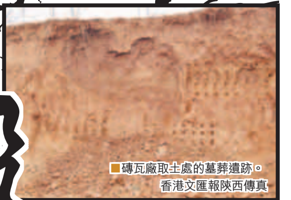
磚瓦廠取土處的墓葬遺跡。

記者看到，位於陝西省商洛市丹鳳縣的商鞅封邑遺址東南部城牆外側的磚瓦廠至今仍未停止生產，其周邊大量取土之處明顯露出墓葬和城牆夯土遺跡。有關文物專家痛心疾首地說，幾千年前的寶貴遺產就這樣被破壞了，這種肆意踐踏文物的行為可以說是毀滅性的。