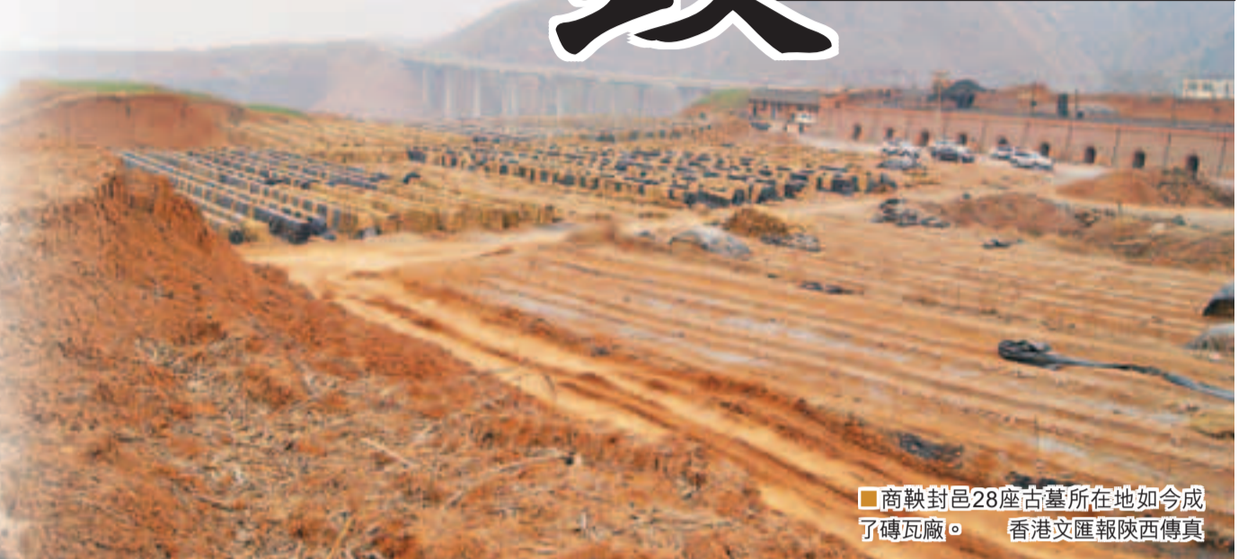
商鞅封邑28座古墓所在地如今成了磚瓦廠。

1996年8月1日至12月25日，考古人員對該墓地進行了考古勘探和搶救性發掘，在6000多平方米的範圍內共發現了100座墓葬，對其中72座進行了發掘清理。「由於另有工作任務，墓地西部尚有28座已經探明的墓葬未能進行發掘」。然而，令考古人員始料未及的是，這些當年未能發掘的古墓到如今卻「變身」為一座更大的磚瓦廠。