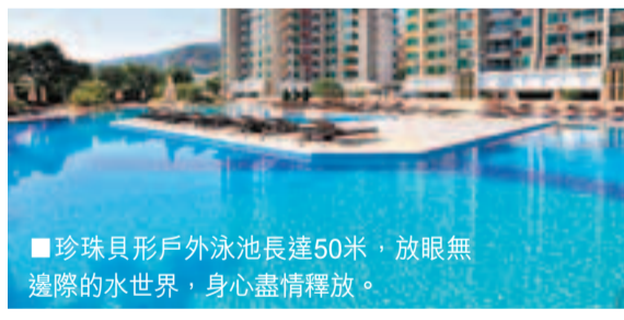
■ 珍珠貝形戶外泳池長達50米，放眼無邊際的水世界，身心盡情釋放。

全區最大最豪華園林會所※，特設主會所、男、女士及兒童專屬會所、3大享樂廳，逾70項室內外多元化玩樂設施，包括長達180米魯賓遜漂流河、50米珍珠貝形戶外泳池及室內泳池等。