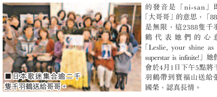
日本歌迷集會逾三千隻千羽鶴送給哥哥。

香港文匯報訊 4月1日是張國榮(哥哥)的死忌,哥哥的歌迷和生前好友都舉辦紀念活動,由於她們寫給哥哥的訊陳淑芬(陳太)身在合肥,所以在離港前已往拜祭張國榮,陳太