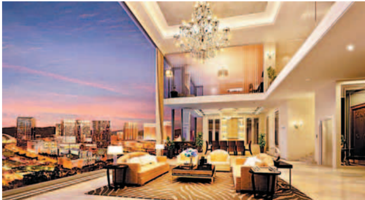
■「御鑽天池大宅」採用三複式之天際玻璃屋設計，高7米之高曠廳堂及特闢銀幕觀景窗，成就最頂級生活空間。