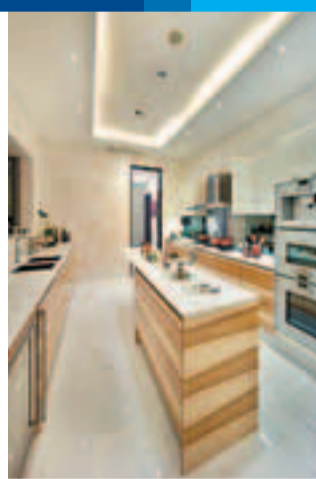
■3座A單位(2,405平方呎)之寬敞廚房呈新派廚房設計，更備有早餐區，盡顯澳門大宅之非凡氣派。

「御海·南灣」，總投資額預計至少逾二百億港元，以國際頂級建材用料打造內外，平均建築成本比澳門其他樓盤超出3至4倍或以上，強勢改寫澳門豪宅尊貴新定義。發展商不惜工本的建築用料、整體設計及規劃的每個細節中均盡顯豪宅氣派。項目採用歐洲皇室貴族均指定的德國原廠進口 Poggenpohl 廚櫃系列及歐洲原廠進口 Gaggenau 家電，浴室亦選用來自美國的頂級品牌 KOHLER 潔具及意大利原廠進口 Zucchetti 潔具，單單廚房及浴室配置價值已高達150萬至250萬港元，創澳門有史以來最尊貴廚房浴室。其中，「御海·南灣」採用了 Gaggenau 最頂級的 Verio Cooling 雪櫃系列，不銹鋼內籠及全金屬配置，單價高達20萬元，亦為全澳門首個住宅項目選用，盡顯極致不凡。此外，戶戶均採用雙層中空玻璃、德國原廠進口 Boen 木地板，以及美國原廠進口 Baldwin 門鎖，將澳門豪宅之尊貴定義重新改寫。