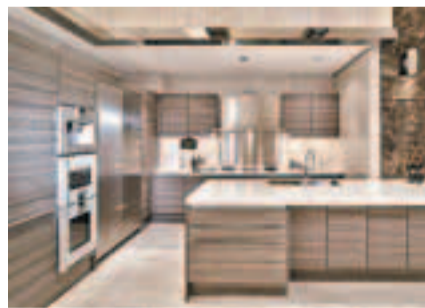
■浴室亦選用來自美國的頂級品牌 KOHLER 潔具及意大利原廠進口 Zucchetti 潔具，創澳門有史以來最尊貴廚房浴室。