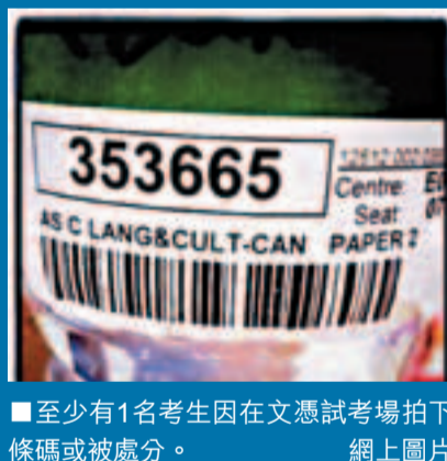
至少有1名考生因在文憑試考場拍下條碼或被處分。