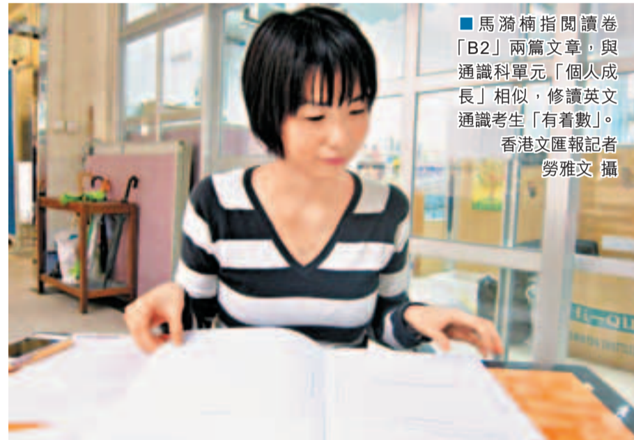
馬滿楠指閱讀卷「B2」兩篇文章，與通識科單元「個人成長」相似，修讀英文通識考生「有看數」。