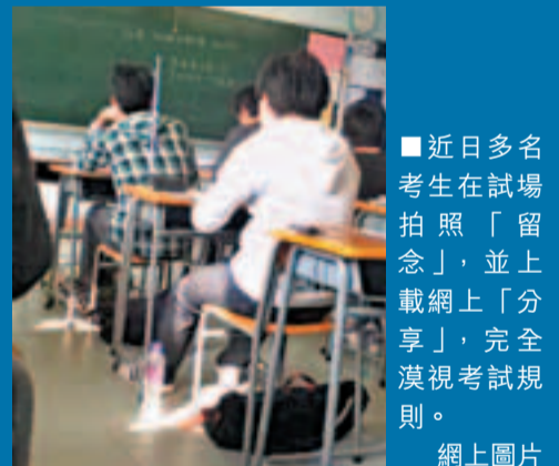
近日多名考生在試場拍照「留念」，並上載網上「分享」，完全漠視考試規則。網上圖片